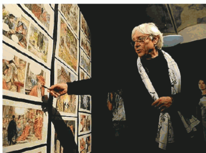
Milo Manara a Siena con le sue tavole

Quale omaggio al tratto più onirico dell'arte di Milo Manara, inoltre, in apertura della rassegna, (che viene curata da Visionaria associazione culturale, attiva da oltre 10 anni sul