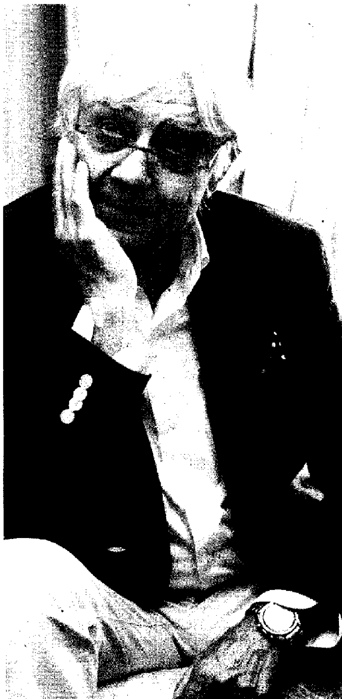
MAESTRO La mostra di Milo Manara apre le porte a film di registi italiani e stranieri